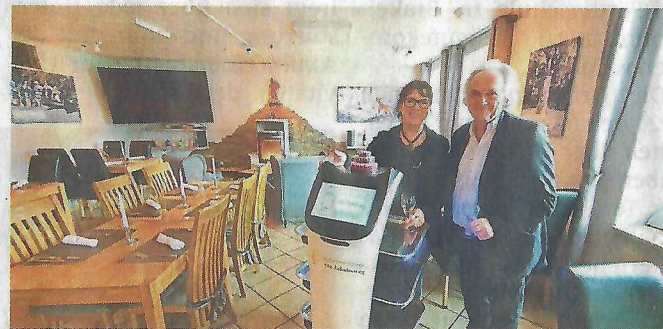
Blick in den Gastraum im Restaurant.