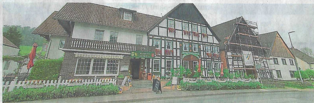
Hotel Am Jakobsweg in Ovenhausen bei Höxter.